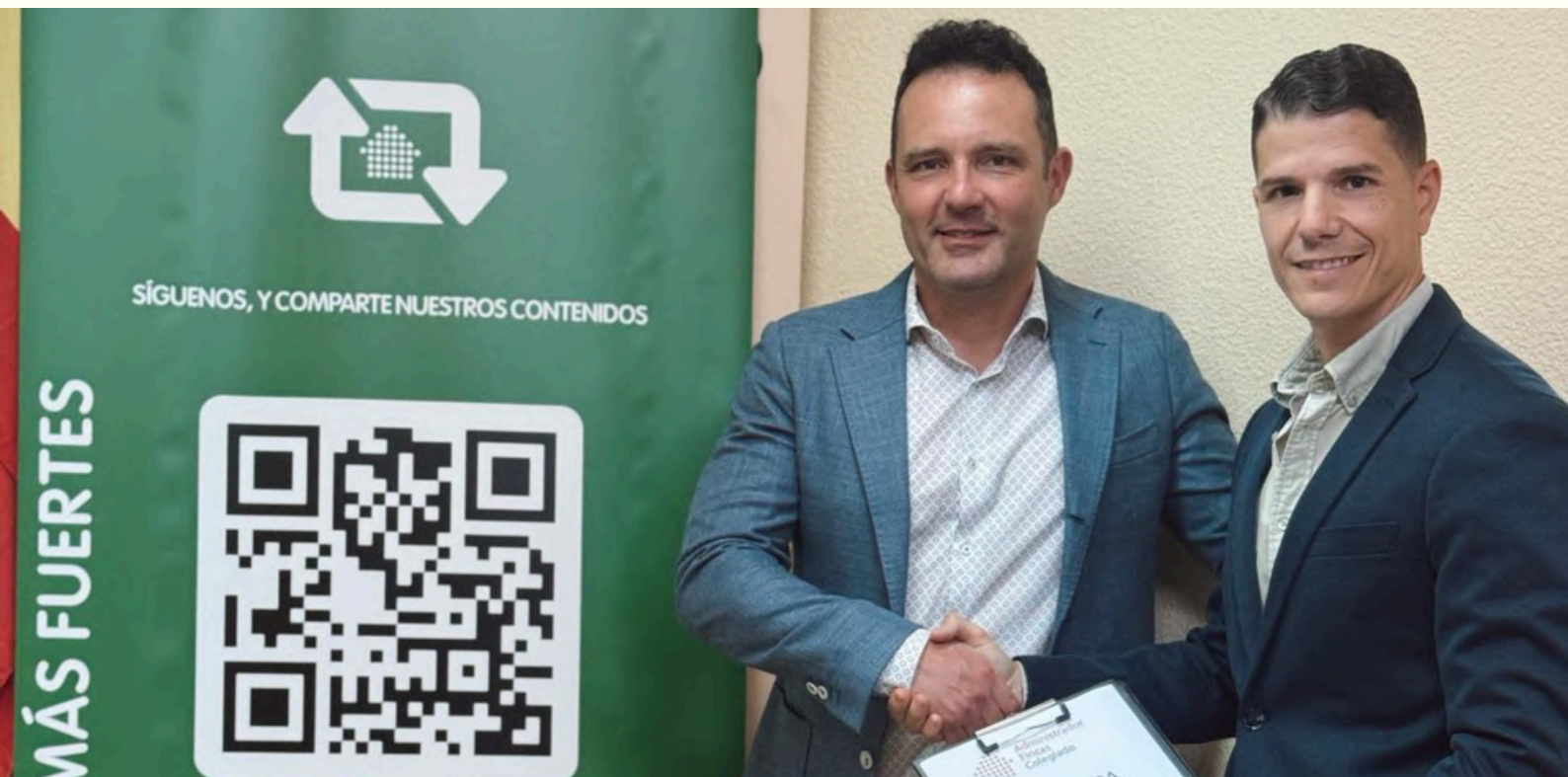
El presidente del CAF Córdoba junto a uno de los representantes de la entidad colaboradora.

Córdoba - El Colegio de Administradores de Fincas de Córdoba , ha suscrito un nuevo convenio de colaboración con la empresa especializada Otis Mobility, reforzando así su compromiso con la mejora continua de los servicios ofrecidos a los administradores de fincas colegiados y a las comunidades de propietarios que gestionan.