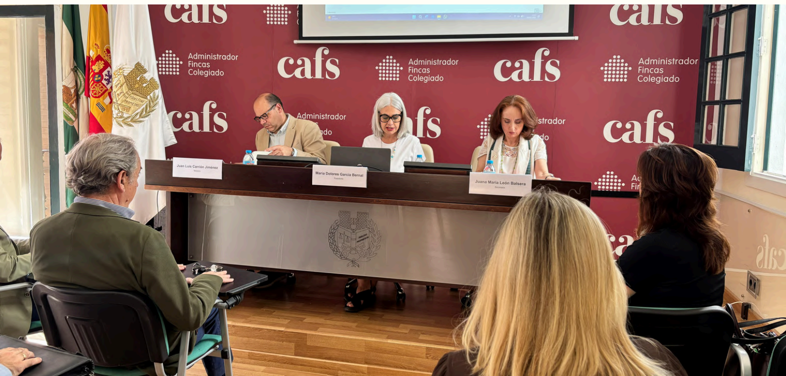
Momento de la Junta General Ordinaria de Colegiados en la sede del CAFS

Sevilla- El Colegio de Administradores de Fincas de Sevilla (CAFS) ha celebrado la Junta General Ordinaria de Colegiados, un encuentro fundamental para abordar distintos asuntos relacionados con la actividad y la gestión colegial.