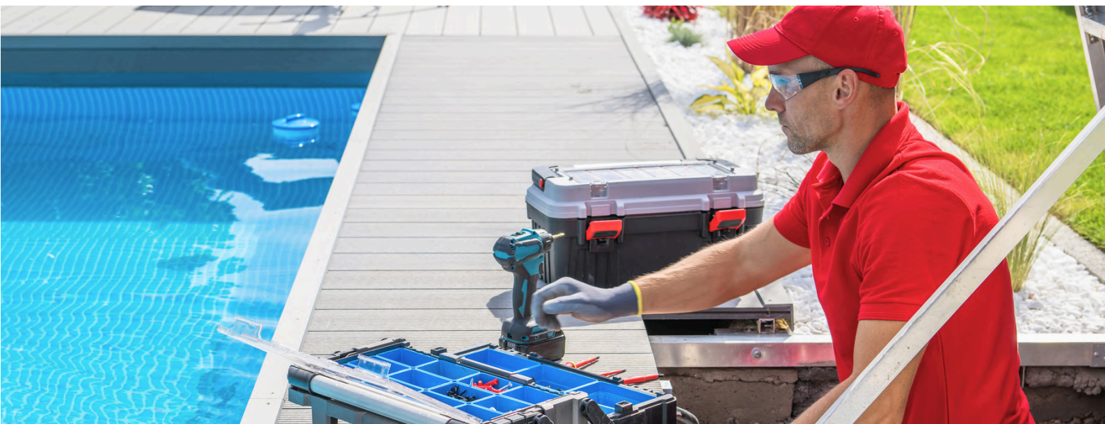
Operario de mantenimiento de piscinas en una comunidad de propietarios

Andalucía - El Consejo Andaluz de Colegios de Administradores de Fincas (CAFINCAS) advierte de que miles de comunidades de propietarios deberán adaptar en los próximos meses la situación de su personal de mantenimiento de piscinas a la normativa vigente, que establece la obligatoriedad de contar con la debida certificación profesional antes del 2 de enero de 2027.